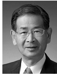
「青春とは人生のある期間を言うのではなく、心の様相を言うのだ」とアメリカの詩人サミュエル・ウルマンは述べていますが、あなたは人生100歳時代をどう生きますか？長生きを競うことも大切ですが、自分らしく素敵に輝いて人生後半を豊かに歩みたいものです。そこでセカンドライフにおけるさまざまな課題に包括的に対応し、生涯現役・生涯青春を実現する心構えを展望します。

「青春とは人生のある期間を言うのではなく、心の様相を言うのだ」とアメリカの詩人サミュエル・ウルマンは述べていますが、あなたは人生100歳時代をどう生きますか？長生きを競うことも大切ですが、自分らしく素敵に輝いて人生後半を豊かに歩みたいものです。そこでセカンドライフにおけるさまざまな課題に包括的に対応し、生涯現役・生涯青春を実現する心構えを展望します。 「セカンドライフにおける大切な課題と対応策」 ・自分ファーストで描く「豊かな未来設計」 ・仕事でも中・長期計画があり、これからの人生設計は自分中心です。今後の長い人生を展望し、どこで、誰と、どのような人生を歩むかを明確に描いて下さい。「固定概念に縛られず前向きに！」がポイントです。 ・「豊富な情報に振り回されず、自分の流しで経済的基盤の確立」 ・前項で触れた今後の人生設計に基づいて、生涯にわたる資金の準備を現役の内訳に下し下さい。ただし、「豊かな生活」豊富な経済基盤にはありません。必要に数字を放浪されず、自分なりの豊かさの尺度を基準に下し下さい。 ・「誰かが予備軍！避けて「周囲との人間関係」